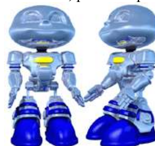
Figura 1. Início da modelagem do personagem Ed em 3D.

O intuito do projeto era o desenvolvimento de um personagem virtual/robô (voltado para o público infanto-juvenil), que pudesse se comunicar com as pessoas para esclarecer dúvidas sobre alguns temas afins, entreter, ensinar e interagir com as pessoas. Alguns dos temas abordados pelo robô virtual são: utilização racional dos derivados do petróleo e do gás natural, preservação de energia, meio ambiente, projetos e dicas de economia [Ibid].