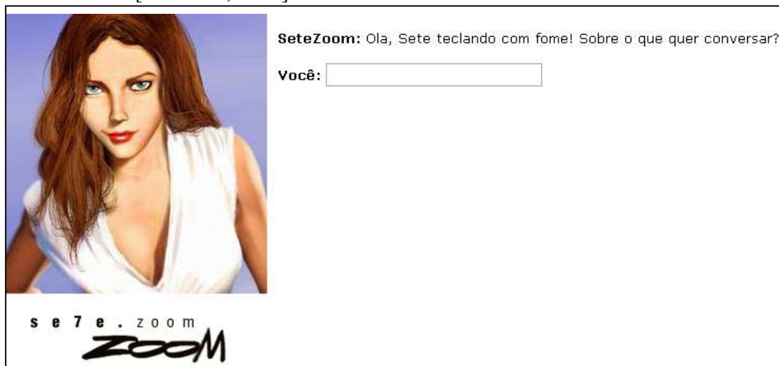
Figura 3. Janela de conversação do chatbot SeteZoom.

De acordo com os desenvolvedores a linguagem utilizada no projeto foi desenvolvida pela própria empresa e se chama BDL (Bot Description Language) e utiliza conceitos de inteligência artificial, lingüística, análise sintática, semântica e morfológica, além de modelos de tomadas de decisão, processamento de linguagem natural, estatística, análise de padrões, Lógica Fuzzy e métodos de representação do conhecimento [Medeiros, 2002].