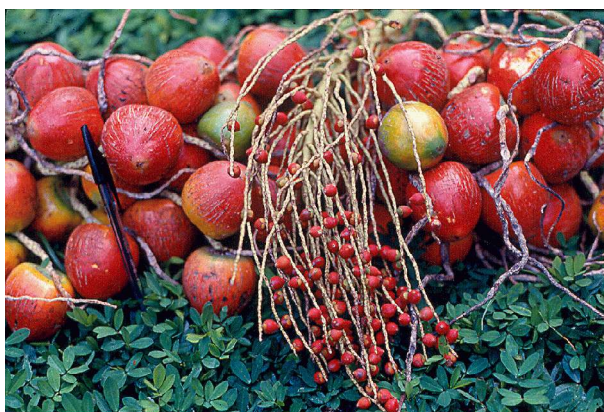
Bactris gasipaes var. gasipaes e var. chichagui